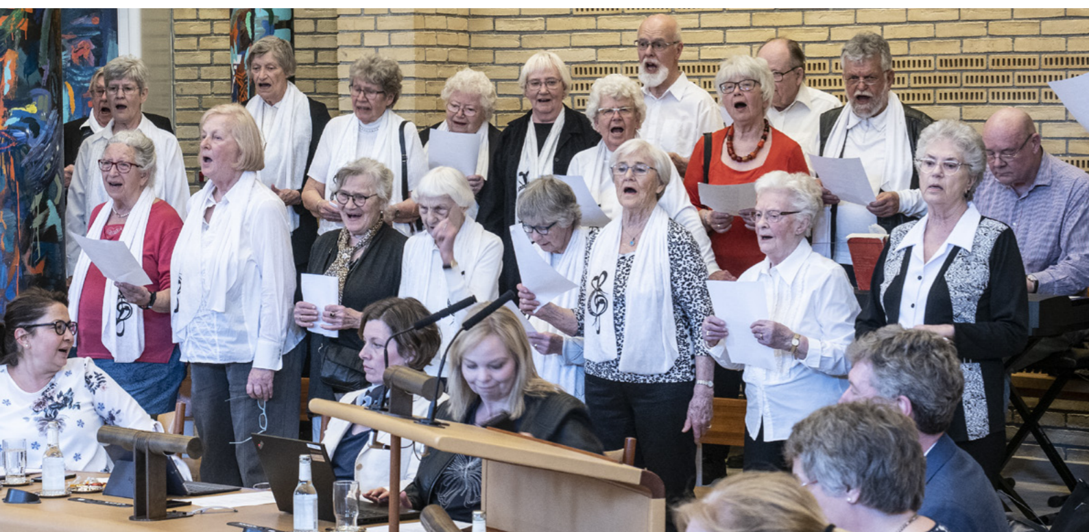
Sangkoret Svalernes svanesang ved byråds-mødet i april 2018.

De første venskabsbyer var som nævnt nordiske, men da Danmark som helhed orienterede sig mod dels NATO dels EF, var det naturligt at de i alt 42 danske kommuner, som i venskabsbytankens storhedstid i 1960'erne og 70'erne arbejdede med venskabsbyer, også udvidedes til at omfatte resten af Europa. I en opgørelse fra Danske Kommuner nr. 11, 1987 kan man læse, at danske kommuner og amter samlet set havde 562 venskabsbyaftaler, hvoraf de 452 lå i norden, de 88 i Vesteuropa, mens østlandene tegnede sig for 16, USA for 4 og Israel for 2. Aalborg var den eneste kommune med flere venskabsbyer end Gladsaxe, nemlig hele 20.