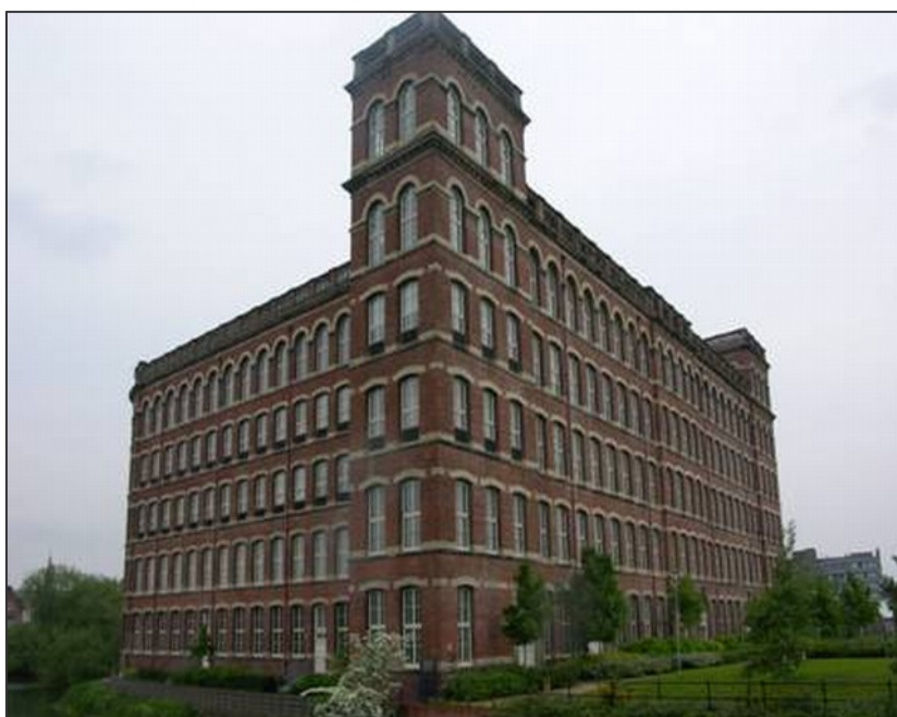
Stor fabriksbygning i 6 etager med glasatrium i midten.